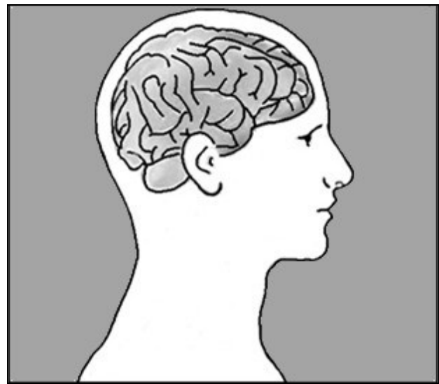
Unser Gehirn konstruiert die Körperwahrnehmung

Ist eine Körperregion mit negativen Erinnerungen behaftet, kann es sein, dass unser Gehirn